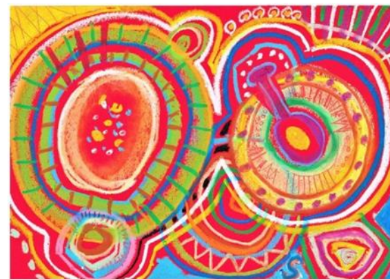
No.29 「広がる丸いかたち」