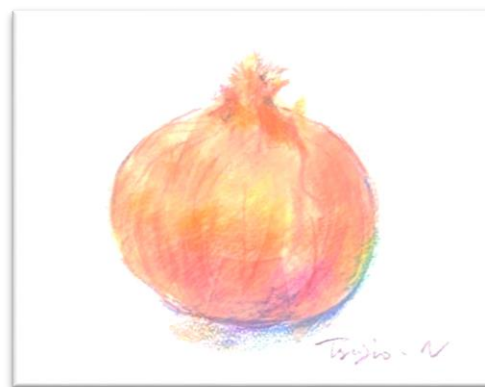
No.34 「トレーシングペーパーに描く玉ねぎ」