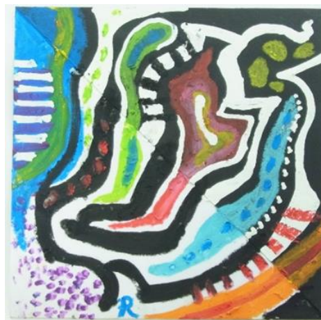
No.13 「ネガポジイロイロ」