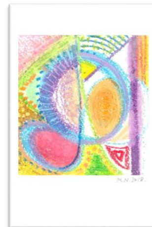
No.18 「My Birthday アナログデザイン」