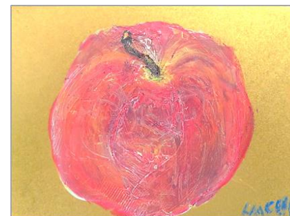
No.14 「ゴールデンアップル」