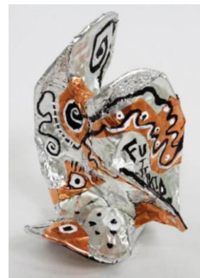
No.12 「メタリックオブジェ」