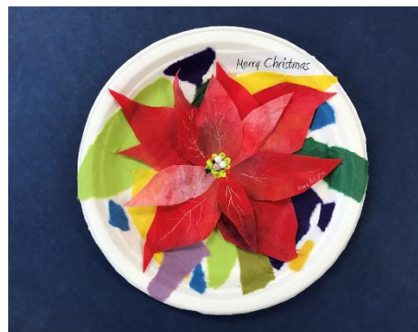
No.1 「ポインセチアのクリスマスプレート」