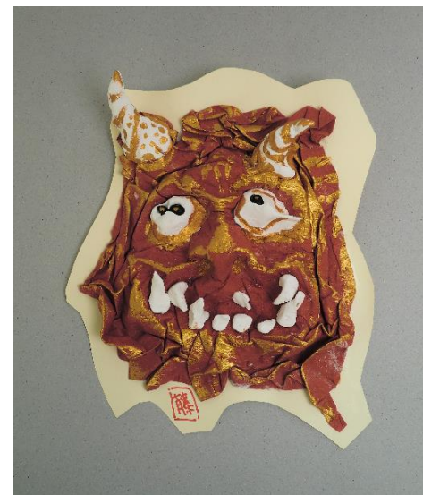
No.3 「鬼の顔のレリーフ」