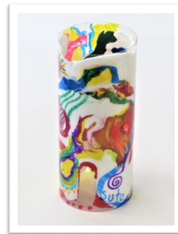
No.11 「浮かぶ色のオブジェ」