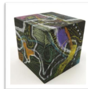
No.13 「ブラックキューブ」