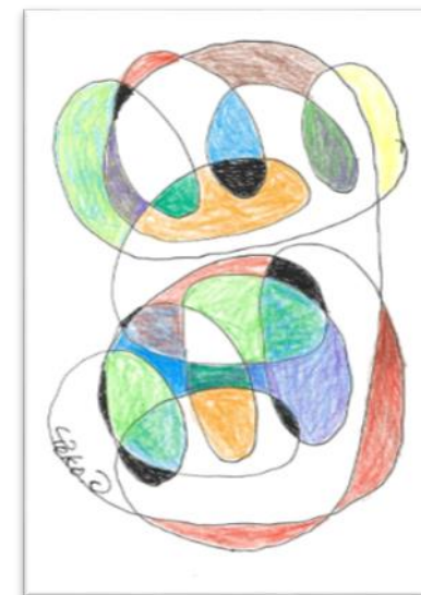
No.3 「らせんらせんらせん」