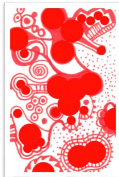
No.5 「赤丸シールデザイン」