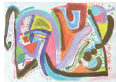
数字の形とアナログ造形表現

No.9 「アクションペインティング」 ※制作場所のセッティング上、1コマ目に行うことがあります。