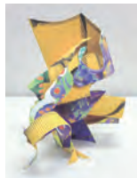
色面からの立体構成