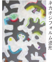
ネガポジフォルム造形