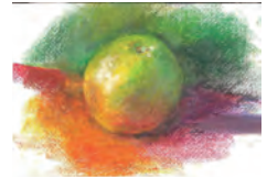
光と陰影・グレープフルーツ