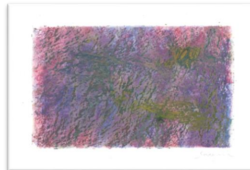
No.4 「色面とマチエール」