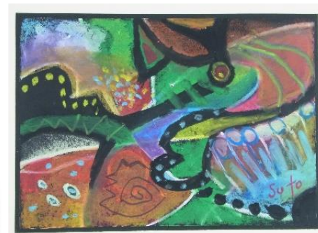
No.23「どんどん変わる色とかたち」