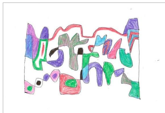
No.17 「にぎやかなリズム」