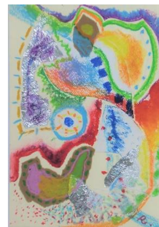
No.24「ペーパーコラージュ」