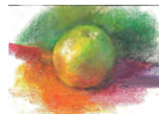
光と陰影・グレープフルーツ