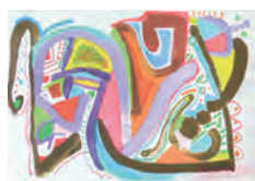
数字の形とアナログ造形表現