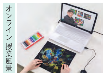
オンライン 授業風景