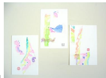
「水の流れ」 「水の暑中見舞」

《持参画材》 脳いさぎ透明水彩絵の具・デザインパレット・丸筆(青・10号)・ 丸筆(黄緑・4号)・筆洗・新聞紙・クロッキー帳・スティックのり・ ポケットティッシュ・はさみ・日本臨床美術協会会員証・ 単位集積記録表(コピー)