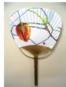
「ほおずきのある団扇」