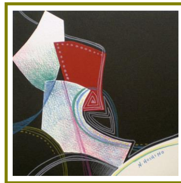
No.9「コラージュパズル」

《研修プログラム》 No.9「コラージュパズル」 参考作品制作 No.10「蝶の軌跡のデザイン画」ポイント説明 No.11「コースターに描く」ポイント説明 No.12「成長する形」ポイント説明 No.13「花空間」ポイント説明 No.14「里芋の触感画」ポイント説明 No.15「朝日の風景画」ポイント説明 No.16「玉ねぎを描く」ポイント説明