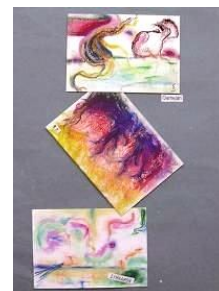
36 選Ⅰ-春2 五感で描くアナログ画 (春バージョン)