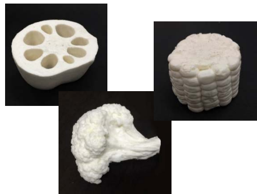
「型取り・複製教室」