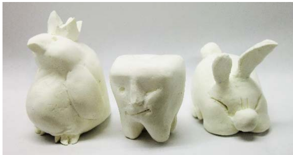
「ゆるキャラ造形教室」