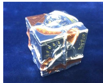
No.7 「アナログメタルキューブ」