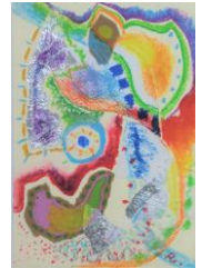
No24 「ペーパーカラーージュ」