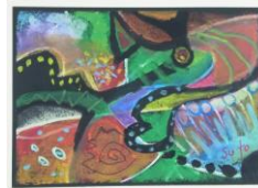
No23 「どんどん変わる色とかたち」