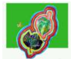
No.18「ステンシルで描く葉っぱ」