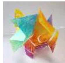
No.16「色彩と空間のコンポジション」

《研修プログラム》 No.16「色彩と空間のコンポジション」参考作品制作 No.17「カラフルリズム」ポイント説明 No.18「ステンシルで描く葉っぱ」ポイント説明