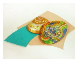
(貝を合わせたサイズ：約9×6×高さ5cm程度 台紙：A5程度)

春の訪れの華やかさを貝に表現します。冬から春への移り変わりをイメージして、平安時代の貴族の遊びだった貝合わせの雅な世界を楽しめます。