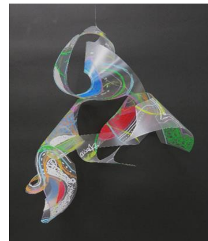
No.30 「オノマトペ・モビール」