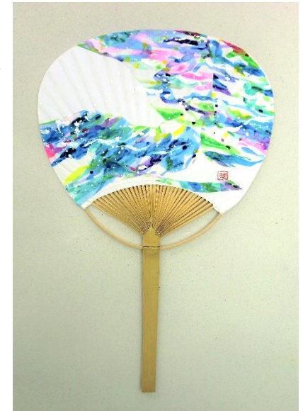
上: No.3 「せせらぎの団扇」