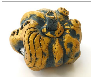
No.18「粘土でつくるプチかぼちゃ」