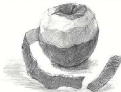
⑤ 皮を途中までむいたリンゴ