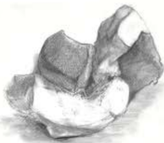
② 白い粘土と黒っぽい粘土