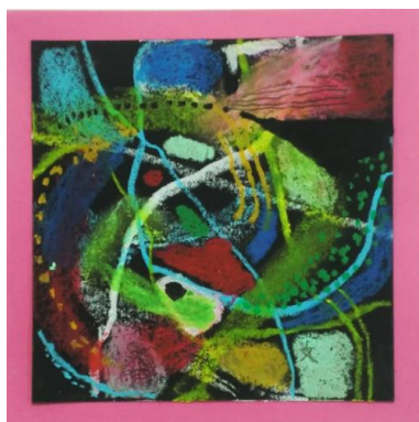
No4. 黒い紙に描くクロッキー