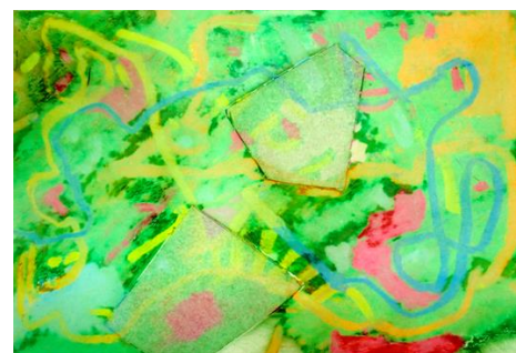
No7. 点と線の削りだし絵