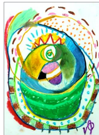
No3. ワクワウウずまき