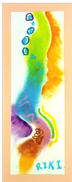
No6. のばして混ぜる色遊び