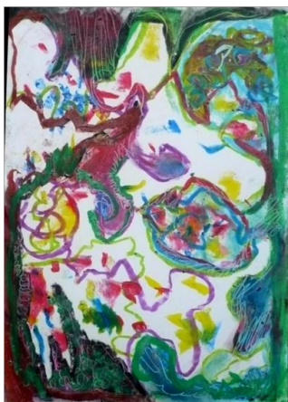
No1. 点から始まるリズム絵・太鼓