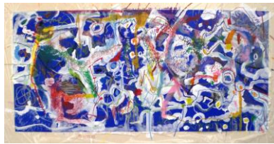
No.24-1 「大きな絵を描こう」 1回目