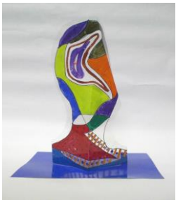
No.26 自分サイズの自分を描く