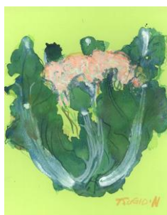
No.5 カリフラワーを描く