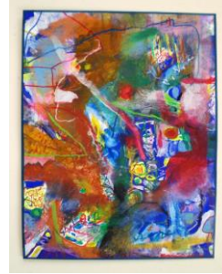
No.24-2 「大きな絵を描こう」 2回目