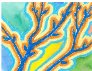
No.2 木の芽のフォルメン