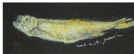
No.18 マチエールと線で描く ししゃも