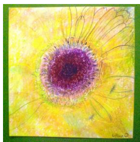
No.3 ガーベラの観察画