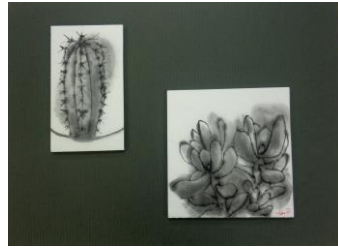
No.20 墨で描くサボテン