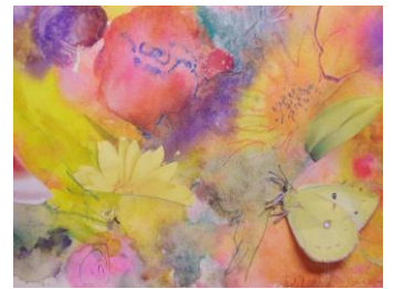
No.25 透明水彩コラージュ「花」