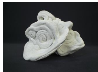
No.28 不思議な形の立体アート