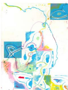
No.33 カタカナプリントデザイン