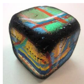
No.34 アナログキューブ