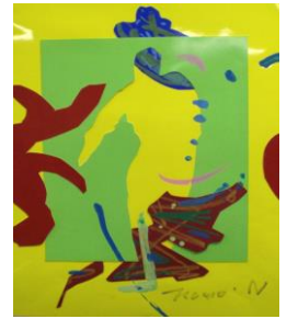
No.22 クロッキーコラージュ(人物)