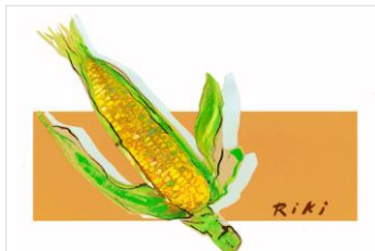
No.10 元気トウモロコシ