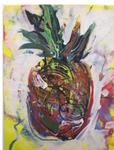
No.7 パイナップルのネガポジ画