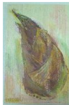
No.4 バルサ材に描くタケノコ