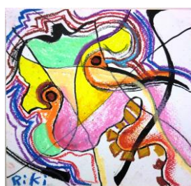
No.17 ピカソのまなざし