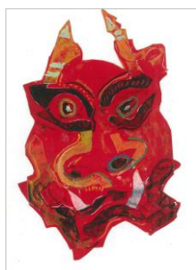
No.6 鬼の顔 紙貼り絵