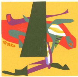
No.19 色のコラージュ(音)