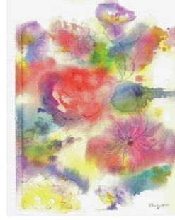
春 3 透明水彩ぬらし絵「花を描く」