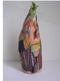
春 7 紙素材で作る立体 筒