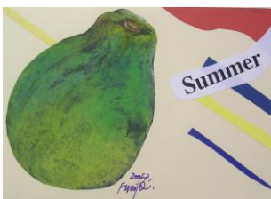
夏 1 トロピカルフルーツの量感画