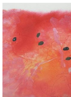
夏 6 スイカの残暑見舞