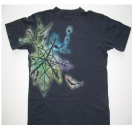
夏 5 Tシャツ「雪の結晶」を描く