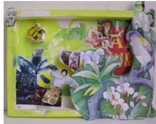
春 6 写真コラージュ(世界旅行)