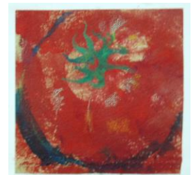
夏 9 野菜の風景画