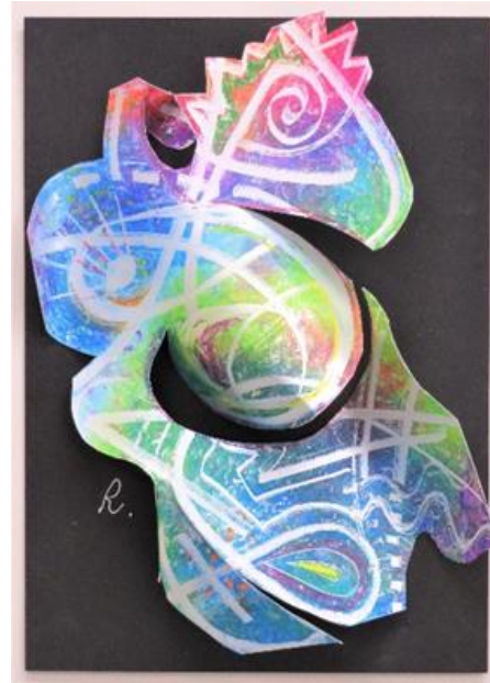
No.33 「メタリックアナログフェイス」