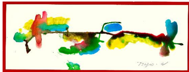
No.2「ゆらぎドリッピング」