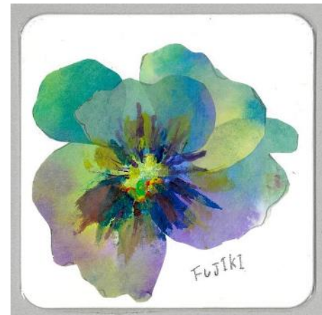
No.1「パンジーのコースター」