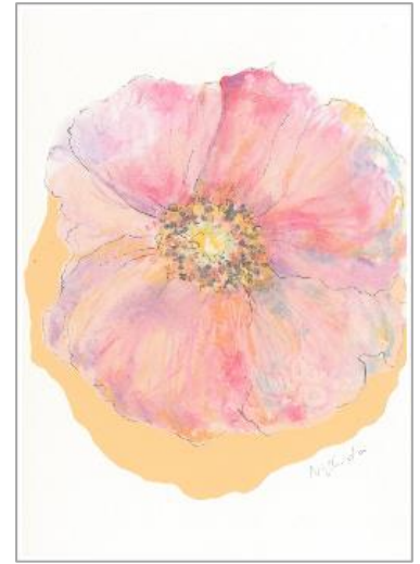
No.31 「ポピーの花を描く」