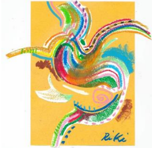
No.32 「ダンシングライン」