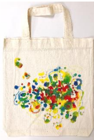
No.4「ホップステップリズム絵」