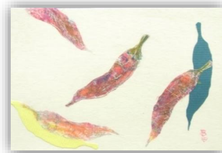
No.47 「とうがらしを描く」