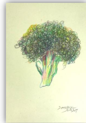
No.45 「ブロッコリーを描く」