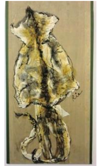
(左)No.3 「カミナリ」 (上)No.1 「するめを描く」