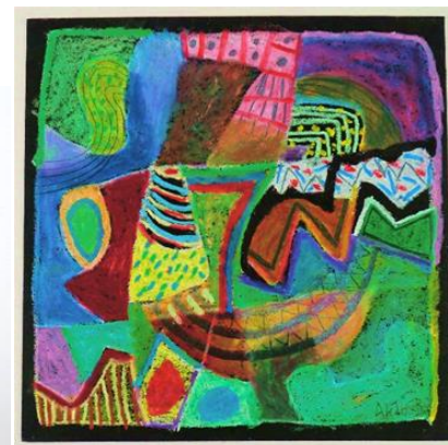
No.27 「パッチワーク遊び」