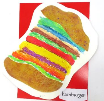
No.25 「マイマイハンバーガー」