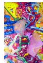
No.7 「点と線の削りだし絵」