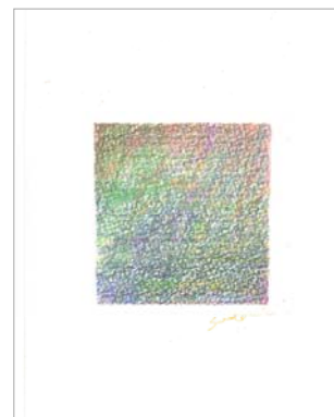
No.2 「ポストカード・美しい色面」