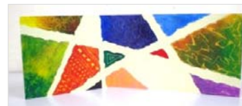
No.12 秋色コレクション