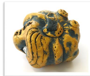
No.18「粘土でつくるプチかぼちゃ」