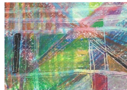
No.7「直線のクロッキー」