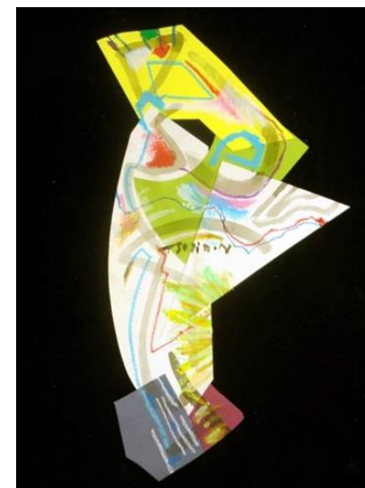
No.15「コラージュ画面からのクロッキー」