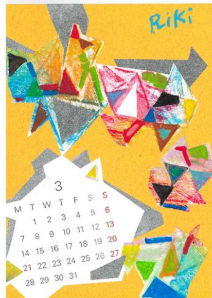
No.3 「フロッタージュカレンダー」