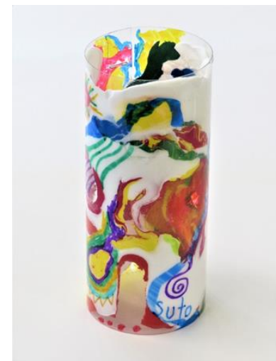
No.11 「浮かぶ色のオブジェ」