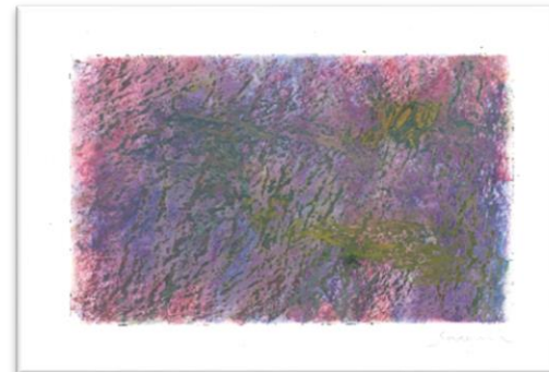
No.4 「色面とマチエール」