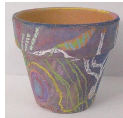
No.6 「植木鉢に描く 地中のアナログ画」