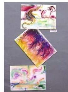
36 選Ⅰ-春2 五感で描くアナログ画 (春バージョン)