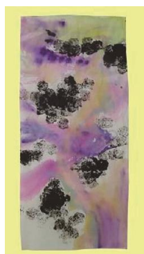
36 選Ⅰ-夏8 清流を描く