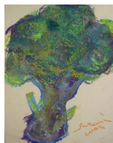
36 選Ⅱ-16 ブロッコリーを描く