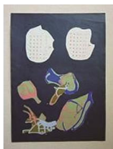
36 選Ⅰ-春5 カレンダードリッピング

※ 左記アートプログラム（36 選Ⅰ、36 選Ⅱ）をお持ちでない方は別途、芸術造形研究所にてご購入ください。 各アートプログラム 3,300 円（消費税 10%込） 弊社ホームページのアートプログラム販売ご案内ページから購入申込書をダウンロードできます。 http://www.zoukei.co.jp/shop/artprogram/ <申込先>アートプログラム販売係 E-mail : e-gazai@zoukei.co.jp Fax : 03-5282-7307