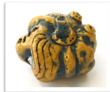
No.18「粘土でつくるプチかぼちゃ」