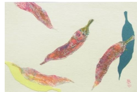
No.47 「とうがらしを描く」