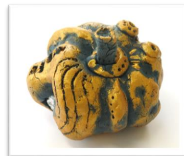
No.18「粘土でつくるプチかぼちゃ」