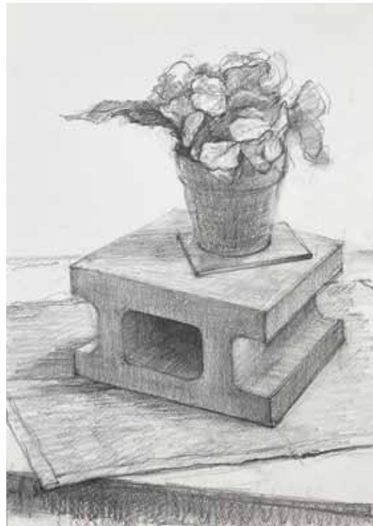
講師習作 「花のある生物」