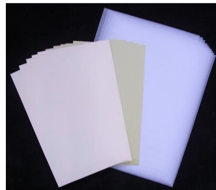
No.15 風の流れのコラージュ