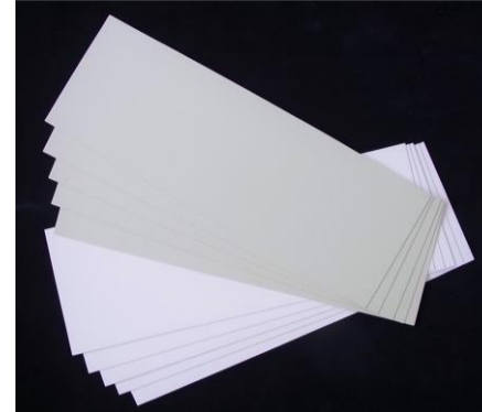
No.12 秋色コレクション