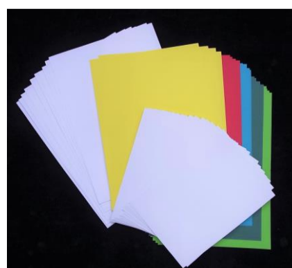
No.18 ステンシルで描く葉っぱ