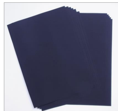
No.2 アジの開きを描く