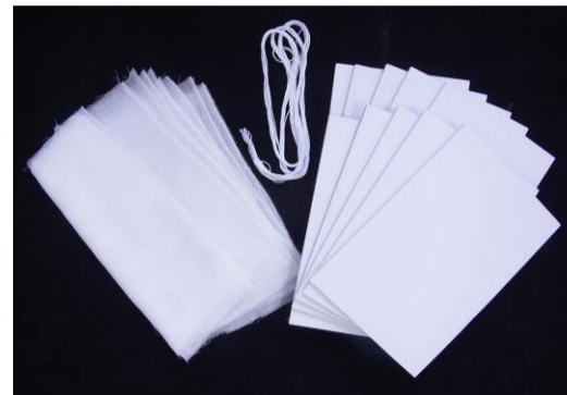
No.13 アナログ・フロッタージュ