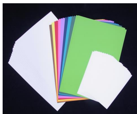
No.1 いろいろな線と色で遊ぼう