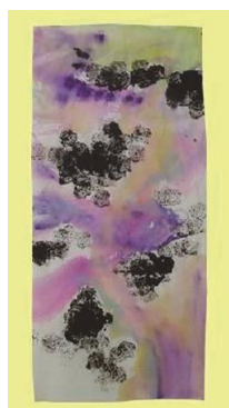
36 選Ⅰ-夏8 清流を描く