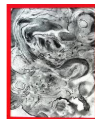
No.4 「抽象画・木炭粉絵」

《持参画材》 脳いさき丸筆(青・10号)・丸筆(黄緑・4号)・ 平筆(黄・8号)・スティックのり・はさみ・鉛筆(HBまたはB)・ ウェットティッシュ・ティッシュ・新聞紙・日本臨床美術協会会員証・ 単位集算記録表(コピー)