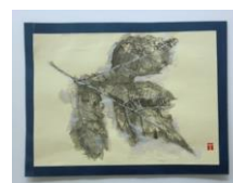
No.5 「虫食いの葉を描く」

《研修プログラム》 No.4 「抽象画・木炭粉絵」参考作制作 No.5 「虫食いの葉を描く」ポイント説明 No.6 「ネガポジにんにく」ポイント説明