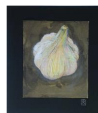
No.6 「ネガポジにんにく」

※すでにテキストをお持ちの方は申込み時にお申し出ください。受講料:8250円(税込) 当日、必ずお持ちのテキストをご持参ください。