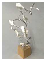
動きのある空間造形