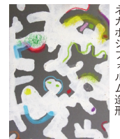
ネガポジフォルム造形