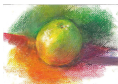
光と陰影・グレープフルーツ