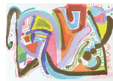
数字の形とアナログ造形表現