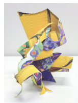
色面からの立体構成