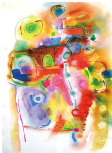
「大画面に滲み、たらし込み」

豊かな色彩体験を通して、自分だけの色彩感覚に気 付いていきます。感じる力が活性化することで色彩 の美しさを発見することができます。内に秘めた美 意識を色彩で確かめてみて下さい。受講生同士でお 互いの色の個性を発見できます。