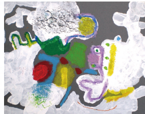
「ネガポジフォルム造形」