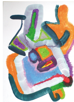
「数字の形とアナログ表現」

物の外形に捉われないムーブマン(動勢)という視 点で、感性に基づいた表現力を高めます。造形要素 の一つである「動き」を表現することで、形と色に“生 命力”や“リズム感”を感じさせることができます。