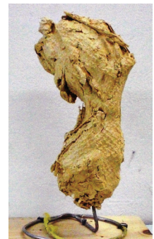
「落花生のオブジェ」