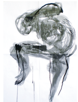
「墨絵ドローイング」