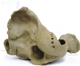
「突きと押し返しのオブジェ」

フォルム(形態)や量感といった視点で、「形」とは何 なのかを探るきっかけを提供し、形を感じる知覚力 を増幅していきます。立体だけでなく、平面性の中 でも、自分自身のフォルムを追求します。