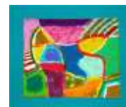
No.8 「紙やすりに描く色面デザイン」