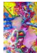
No.7 「点と線の削りだし絵」