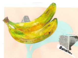
⑳ ツルっと コスって 描くバナナ