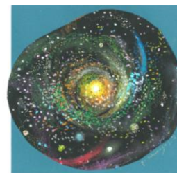
⑱ きらめく星座 宇宙