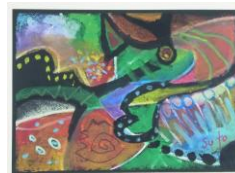
No.23 「どんどん変わる色とかたち」