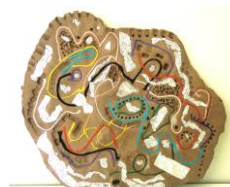
No.8「カラフル系の線あそび」