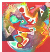
No.26「カラーシユで形あそび」