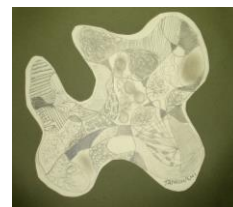
No.1 「鉛筆のアナログ画」