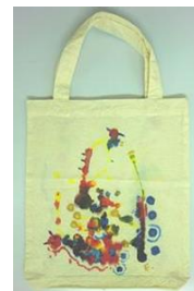
No.4 ホップステップリズム絵