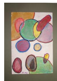
No.3 「線と色のコンポジション」