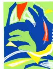
No.5 カラーシュ私の手