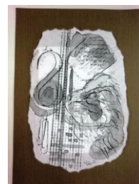
No.6 墨絵フロッタージュ