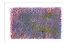
No4 「色面とマチエール」