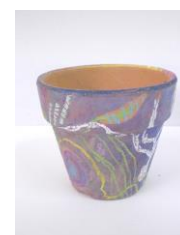
No6 「植木鉢を描く 地中のアナログ画」