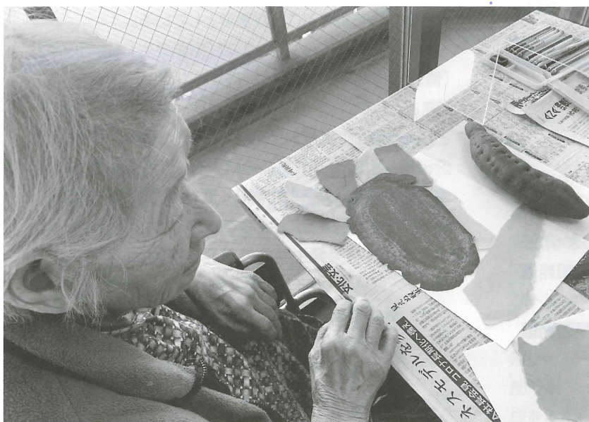
「さつまいもの量感画」に挑む