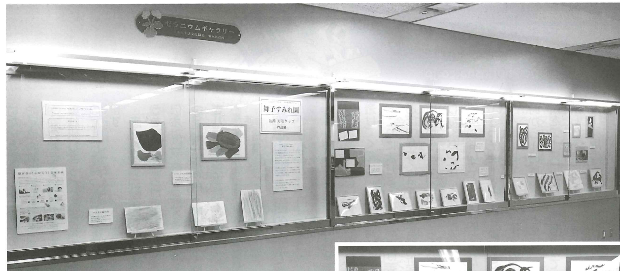
垂水区役所内での作品展(2020年12月)

は自室でご自身の作品とともに過ごしておられます。職員さんたちが、ご家族や思い出の写真の横に作品を飾り、その方に合わせた心地良い部屋作りをしてくださっているのです。