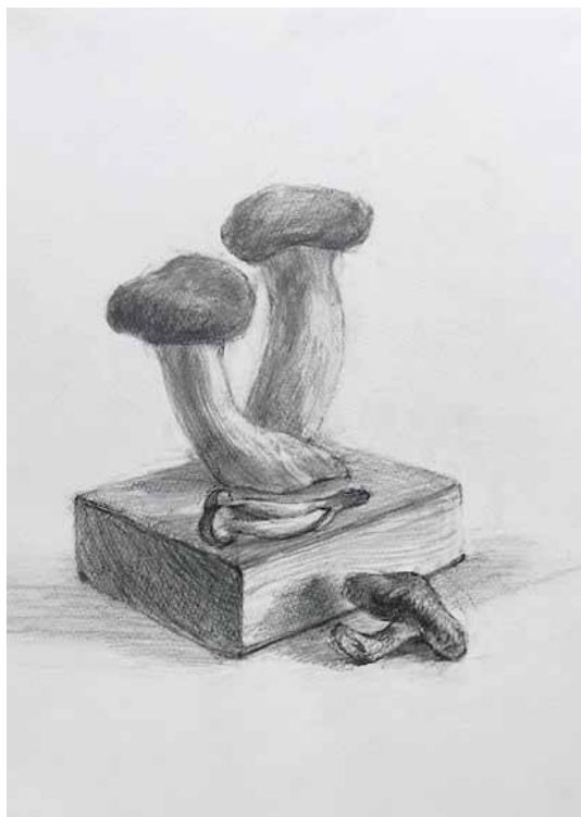
講師習作 「はえるきのこ」