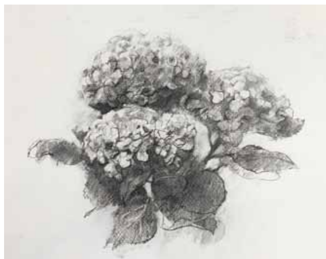
紫陽花のスケッチ 講師習作