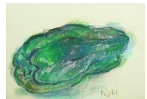
No.19 「ピーマンの量感画」